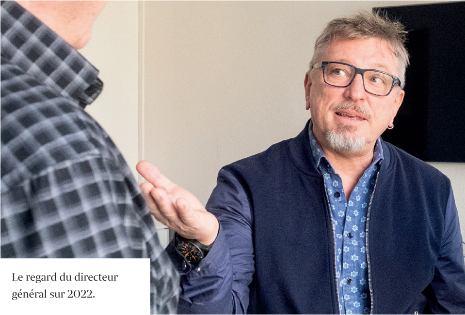
Le regard du directeur général sur 2022.

professionnellement, mais dont le revenu est juste (in)suffisant pour atteindre le minimum vital. Certaines pourraient obtenir des prestations financières et/ou sociales que nous délivrons, mais n'osent peut-être pas s'adresser à nos services de peur d'être stigmatisées ou catégorisées.